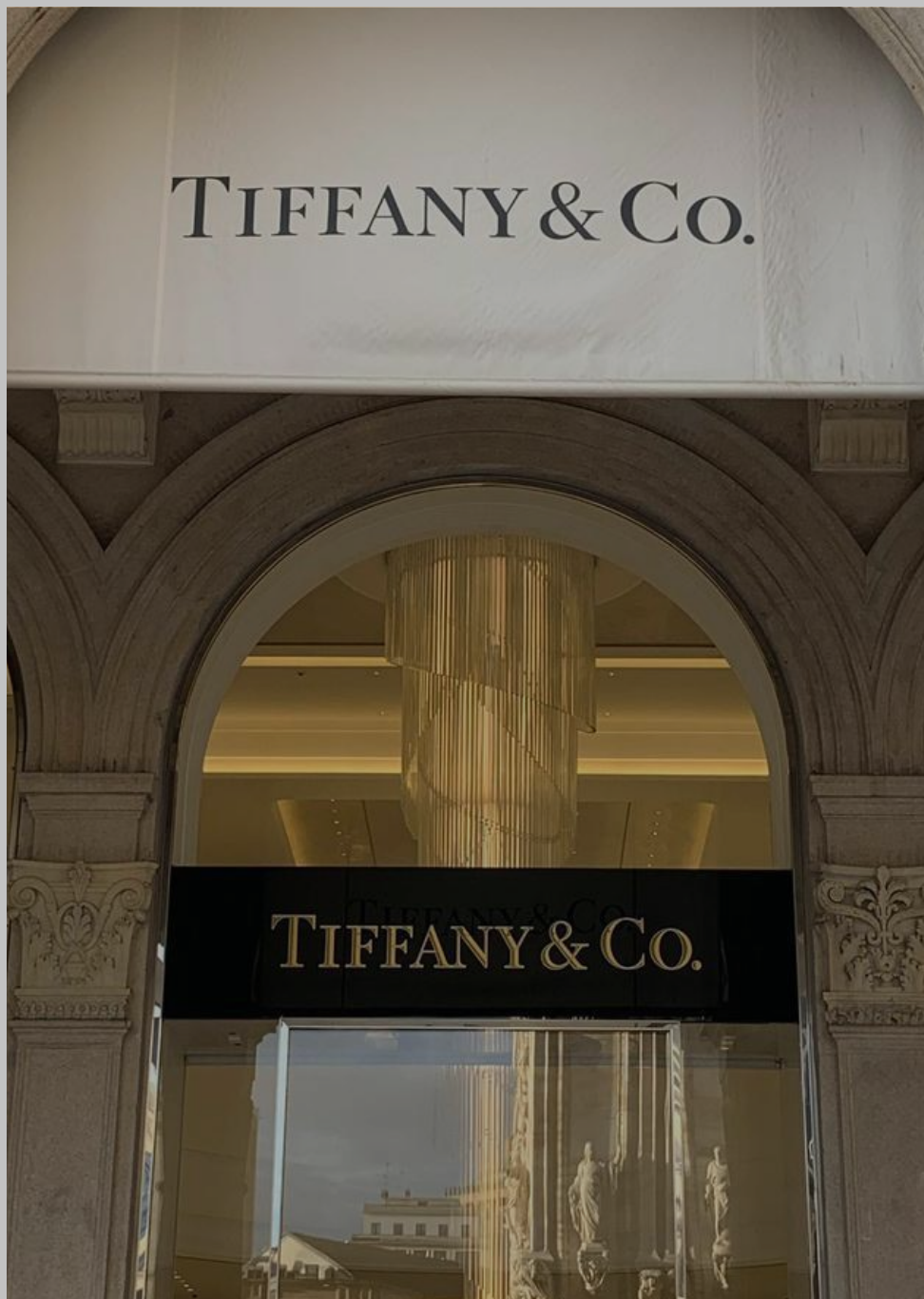
TIFFANY & CO.