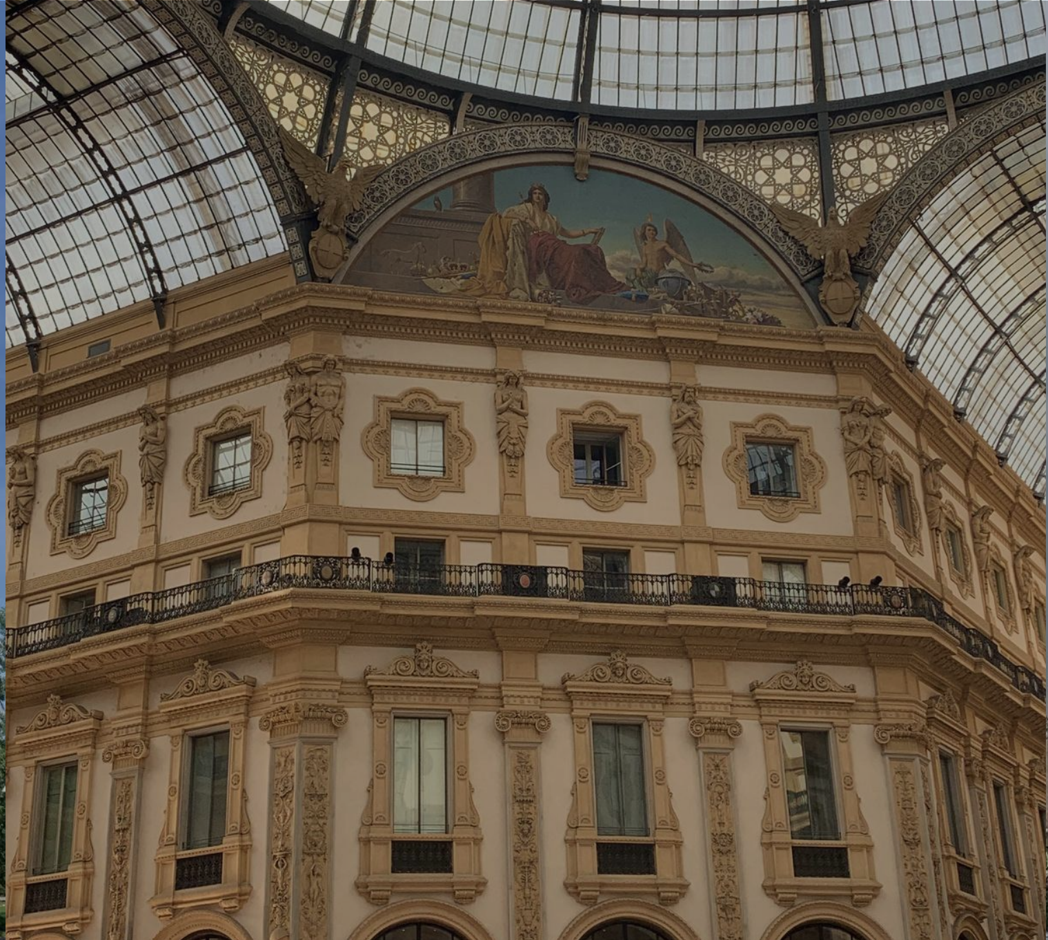
GALERIA WIKTORA EMANUELA II